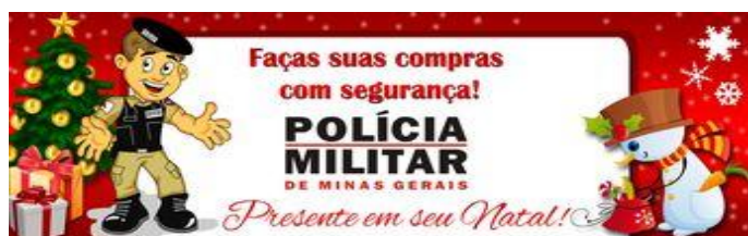
CARTÃO DE NATAL DO CONSEP INTERMUNICIPAL