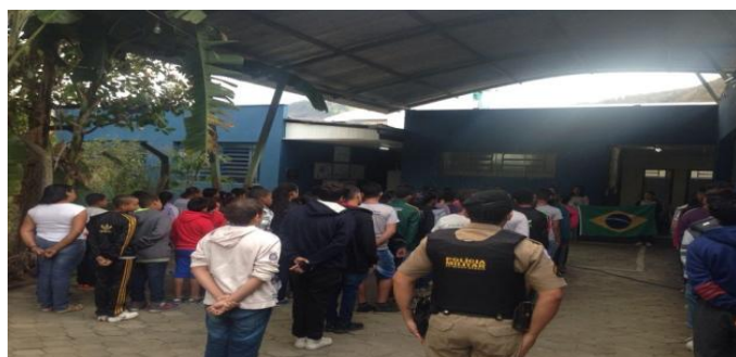
Lagoa do Pau