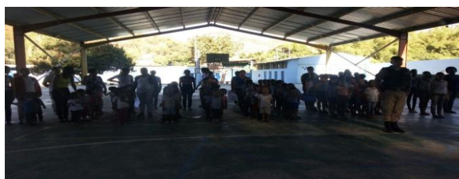
Sede – Jaguarauçu.