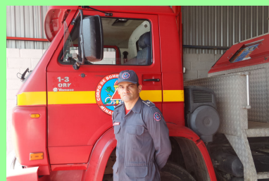
Ten BM Mafra, Comandante do 5º Pelotão BM.