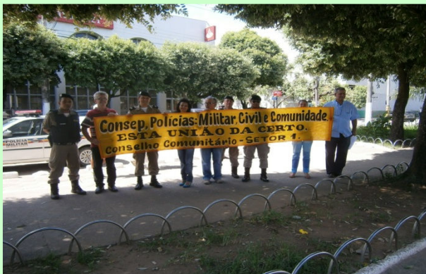
Foto de ação do CONSEP 1 na Alameda 31 de Outubro, Centro Norte.

Nesta oportunidade conclamo a vocês que venham participar conosco nesta luta em prol de mais paz para nossas famílias. Observa-se que vivemos em uma sociedade que não se preocupa com os problemas sociais, dentre eles a questão da segurança pública, que por sinal é dever do Estado, Direito e responsabilidade de todos. CONSEP e Polícias Militar e Civil, “uma união que dá certo”.