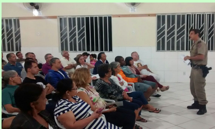
Foto da última reunião do CONSEP 1 no salão comunitário do Vale Verde com a presença de 74 pessoas da comunidade. À frente a diretoria do CONSEP.